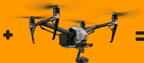
Intervention par drone