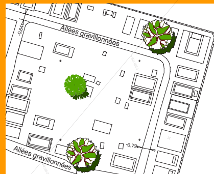
Plan du cimetière