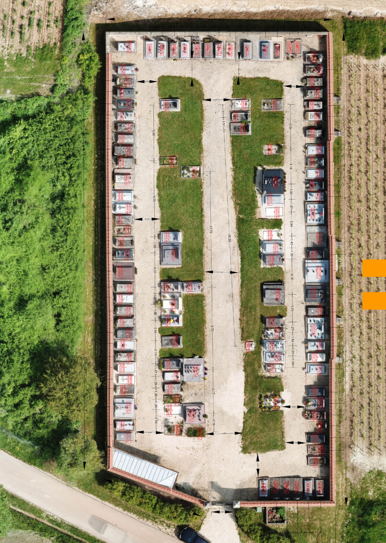
ORTHOPHOTOGRAPHIE FORMAT A0 (1189 mm X 841 mm)